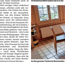
Am Mittwoch in Gaierte hat es der Gaststube deutlich weniger Tische als zuvor.

Die Betreiber sind verpflichtet, die Hygienevorschriften zu befolgen. Sie müssen die Räume regelmäßig reinigen und desinfizieren. Die Betreiber sind verpflichtet, die Hygienevorschriften zu befolgen. Sie müssen die Räume regelmäßig reinigen und desinfizieren.